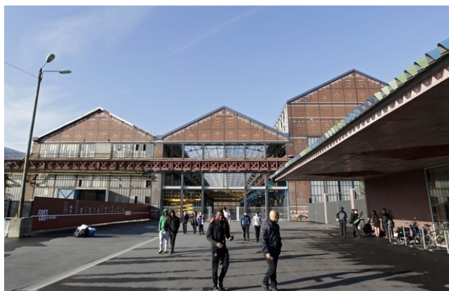
(M. Libert – 20 minutes)

Le site industriel de FCB – Fives Cail Babcock situé dans le quartier de Fives sur la commune de Lille a fait l'objet d'une réhabilitation depuis 2012 après une période de friche de 10 années.